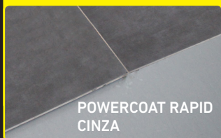
POWERCOAT RAPID CINZA