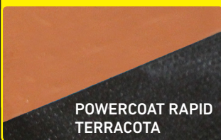
POWERCOAT RAPID TERRACOTA